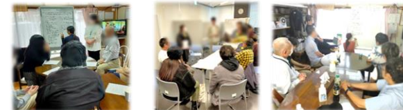
ピアサポートのぞみ ピアサポートちゃんぽん 当事者研究

ミーティング形式の例会や当事者研究、ピアカウンセリングなど毎週活発に行っています。専従のピアサポーターが担当しており、のぞみで大事にしている活動の一つとなっています。