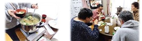
新鮮野菜の具沢山味噌汁です