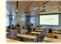
新しい学びが多いです♪