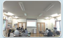
ピアサポーター 事務局 あじさい