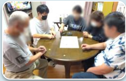
地域活動支援 センターのぞみ