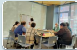
ピアサポート ちゃんぽん