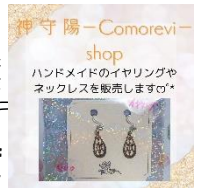
利用者さんによる初出店です!

来月2月11日(日)は13時半より、大橋町東部自治会公民館で音楽バザーを行う予定です! 今回も昨年の6月の市役所バザーにご参加いただいた楽々工房さん、KIZUNAさんなどが出店をされる予定です。初出店として、利用者の方お二人がそれぞれ準備されています。 音楽演奏あり、のぞみのハンドメイド商品販売あり、手作りお菓子など外部出店もありの楽しめるイベントとなります。 皆さん、お楽しみを!