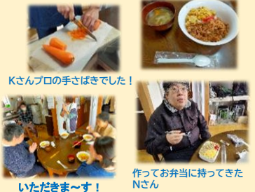
Kさんプロの手さばきでした!