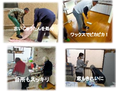
古いカーテンを処分

12月20日(水)と、21日(木)に年末の大掃除を行いました。 参加者は1日目が職員ボランティアも含めて15名、2日目が12名でした。床のワックスかけ、カーテンの洗濯、窓や網戸拭き、玄関周り、台所周り、エアコンのフィルターなどの掃除を行い、音楽室のカーペットも新しいものに変えました。ボランティア、利用者さんのお陰ですとも作業がはかどり、気持ちよく新年を迎えられそうです。ご協力ありがとうございました。