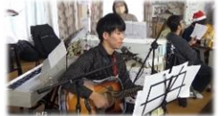
ノゾミを合奏しました!

職員が手分けして用意した心のこもった景品の数々です。みなさん、自分の番号を呼ばれるとお目当ての商品にまっしぐら、笑顔で景品をゲットされていました。 ボランティアの方々には会の準備から運搬、片付けまでお世話になり、お陰様で楽しいクリスマス会を過ごすことが出来ました。