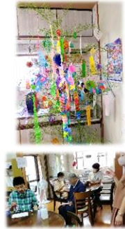
ハンドベルでたなばたさまを演奏!

当日は、参加者全員で「たなばたさま」をハンドベルで演奏し、その後、シャトレーゼのゼリーをじゃんけんで購入した人から選ばれました。スクリーンに絵本をうつして、「だれかがほしをみていた」を鑑賞しました。こうして楽しい30分はあっという間に過ぎました。みんなの願い事がかないますように!