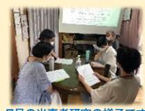
7月の当事者研究の様子です

のぞみでは月に2回水曜日に、ピアサポート活動の一環で「当事者研究」を開催しています。通常の例会よりも少人数で、じっくり話し合うスタイルが特徴的です。一見堅苦しい表現ですが、やっていることはシンプルです。参加者それぞれが自分の「困りごと」を設定し、毎回皆さんで共有して自分なりの対策を深めています。ちなみに聞くだけでの参加でも大丈夫です。(担当/河野・岡本)