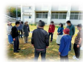
レクリエーション盛り上がりました!