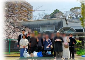
とても良い天気でした!

昨年度の最後の開所日に、お弁当とお茶とお菓子を持って、近所の公園 へお花見に行きました。今年の長崎の桜の開花発表は3/22でしたので、ま だ咲き始めでしたが、みんなレジャーシートを広げてのびのびと花見を楽 しました。晴天に恵まれ気持ちの良いお花見となりました。 3チーム対抗の曲名当てクイズや語彙力ゲーム、しりとり、1、2、3ゲームな ど盛り上がり、みんなで時には大笑いしながら過ごしました。 久しぶりの外での活動を楽しく過ごせたとお思います。