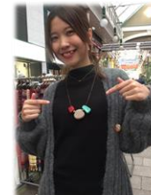
ベルナード出店レジンがたくさん売れました!