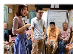
作業療法士としてのレクリエーション活動