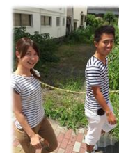
お昼休みにちょっとファミマへ!