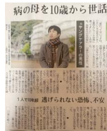
長崎新聞でも取り上げられました!