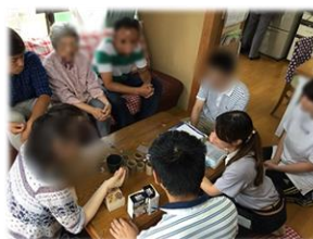
レジン商品化する提案をしてくださいました!