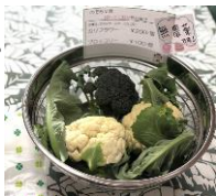
カリフラワー ブロッコリー

まん延防止等重点措置でハートセンターが2月20日まで閉館して利用できませんでした。早くスポーツがしたいです。