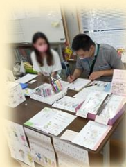
イラストコーナーでは新企画に挑戦しました！