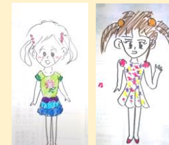
こんなキャラクターができました！