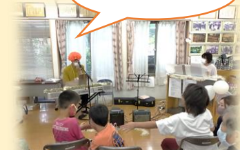
所長もピアノ弾けるんだね～