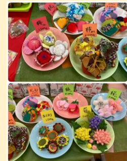
和由美コーナー 素敵な和の作品