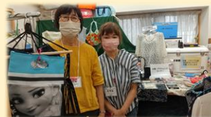
古着コーナーのちらうとのお二人 いつもありがとうございます！