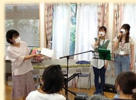
実習生は最終日でした！