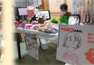
初出店! YOKOばあばの 手作りネックレス