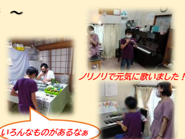
ノリノリで元気に歌いました!