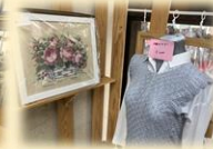
ちらうとの高岩さんの 作品です!